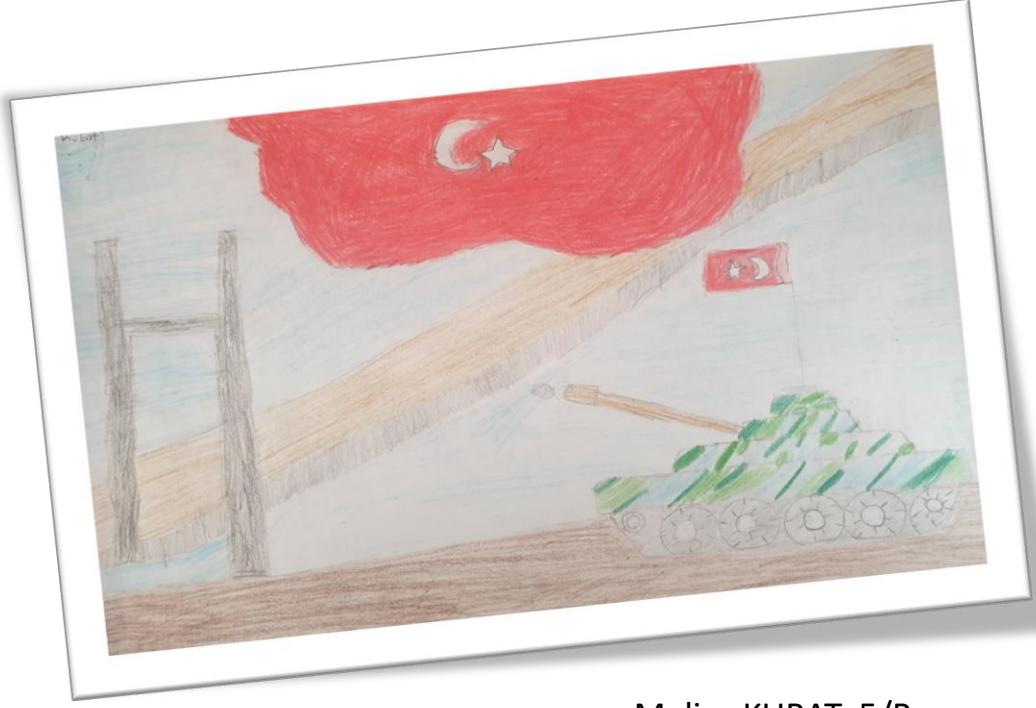
Melisa KUBAT 5/B