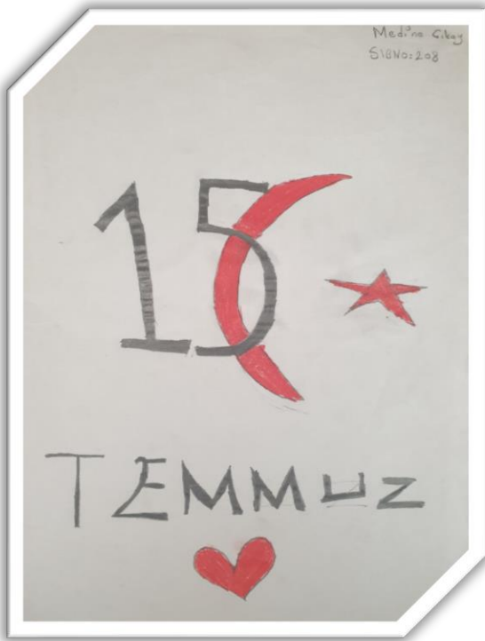
Medine ÇIKAY 5/B